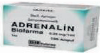
ADRENALİN AMPÜL - PARASEMPATOLİTİK