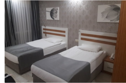
Candidates can benefit from our university guest house

+90 545 565 05 37 (Whatsapp / Telegram) sosyaltiesisler@atauni.edu.tr